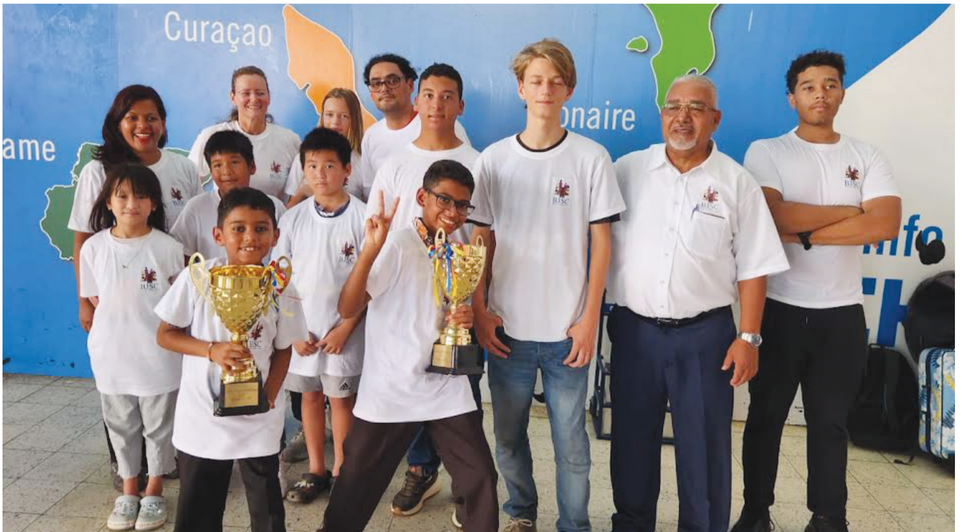
Hóbennan di BJSC (Bonaire Jeugd Schaak Club) a sobresali den e Aruba Chess Challenge 2023. Despues di un preparashon for di mei último e hóbennan a duna bon prestashon, ganando tres premio for di diferente kategoria. Foto ta mustra e delegashon di BJSC ku a biaha pa Aruba.

Hóbennan di klup di ahedres a sobresali na Aruba